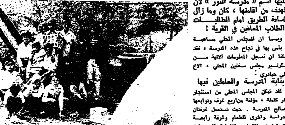
طلاب المدرسة في ساحة الألعاب الخاصة في مدرسة سخنين